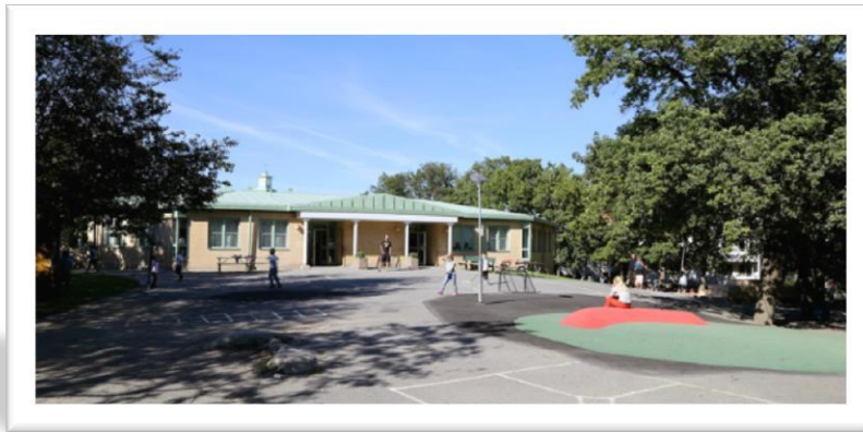
Olaus Petri skola